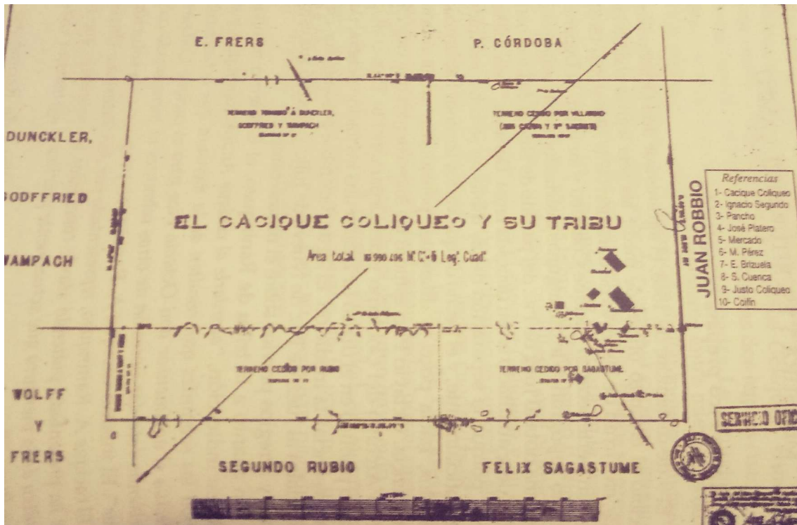
Detalle de la mensura del campo de La Tapera de Díaz (Los Toldos primitivo de 1869) plano que señala los principales ranchos de cacique y capitanejos de la tribu, (Geodesia de la Provincia de Buenos Aires, duplicado N° 14, de General Viamonte)